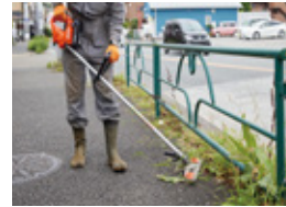
■アスファルト上での作業