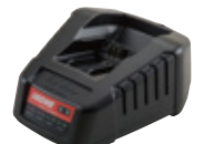
急速充電器 LCJQ-560D 希望小売価格(税込) ¥11,000